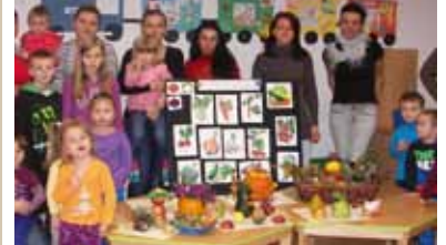
Őszi foglalkozások az óvodában