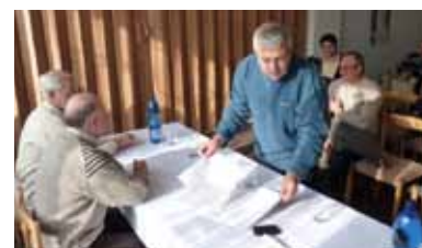
Értékeltek a halászkok